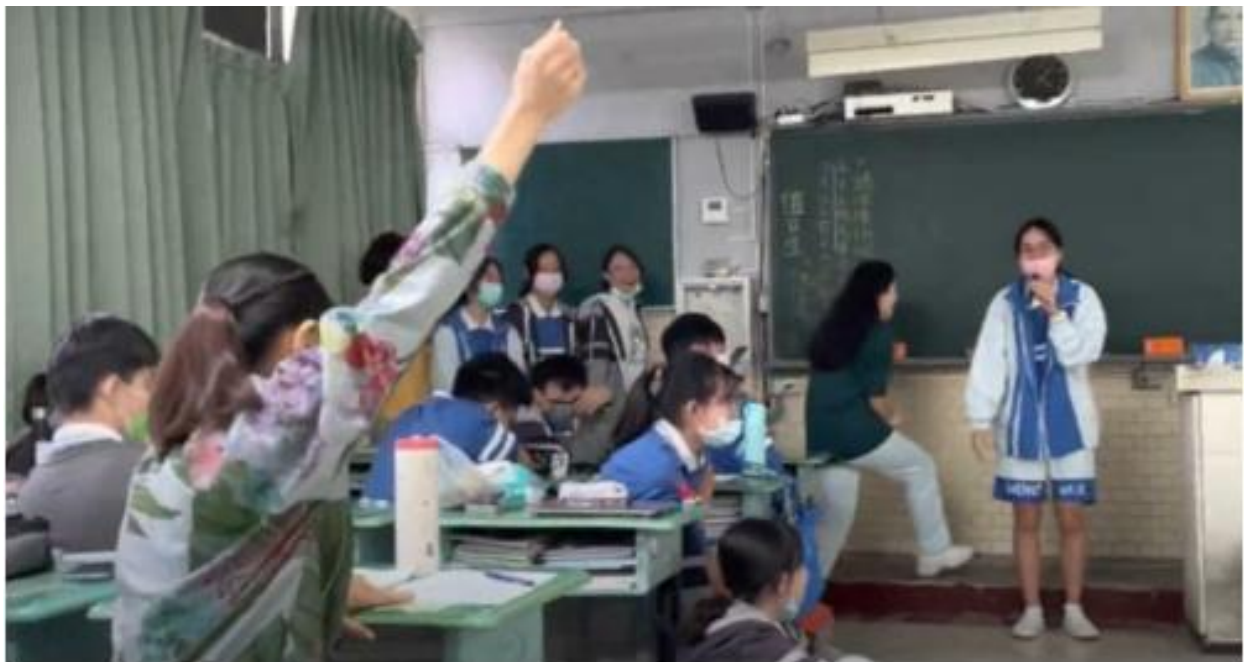
▲照片 4：伊和老師最愛參加有獎徵答了，手舉最高~XD