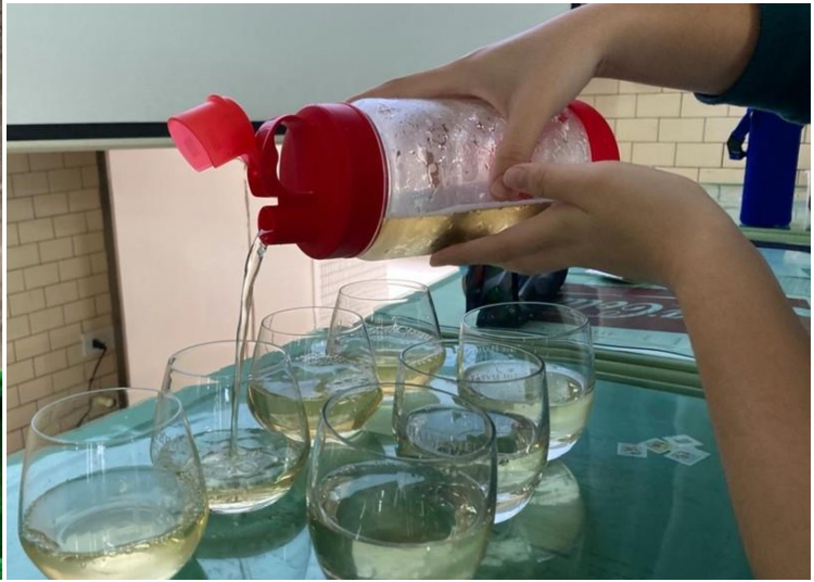
▲照片 5：小組成員提供的「在地特色小獎品」——光復新村高山冷泡茶與茶點