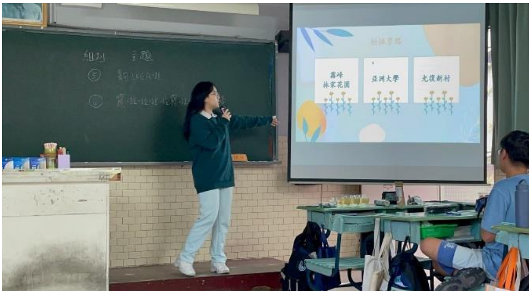
▲照片1：「影導人」一向全班介紹微電影主題