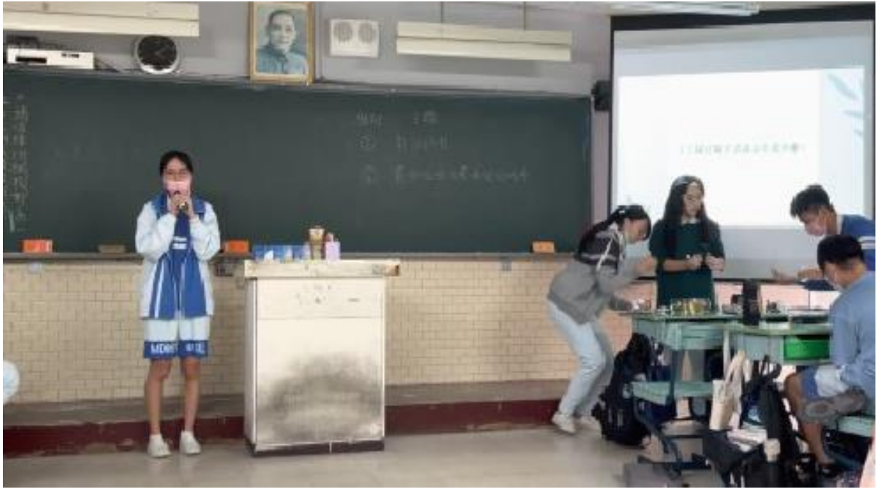
▲照片 3：與全班同學進行「有獎徵答」