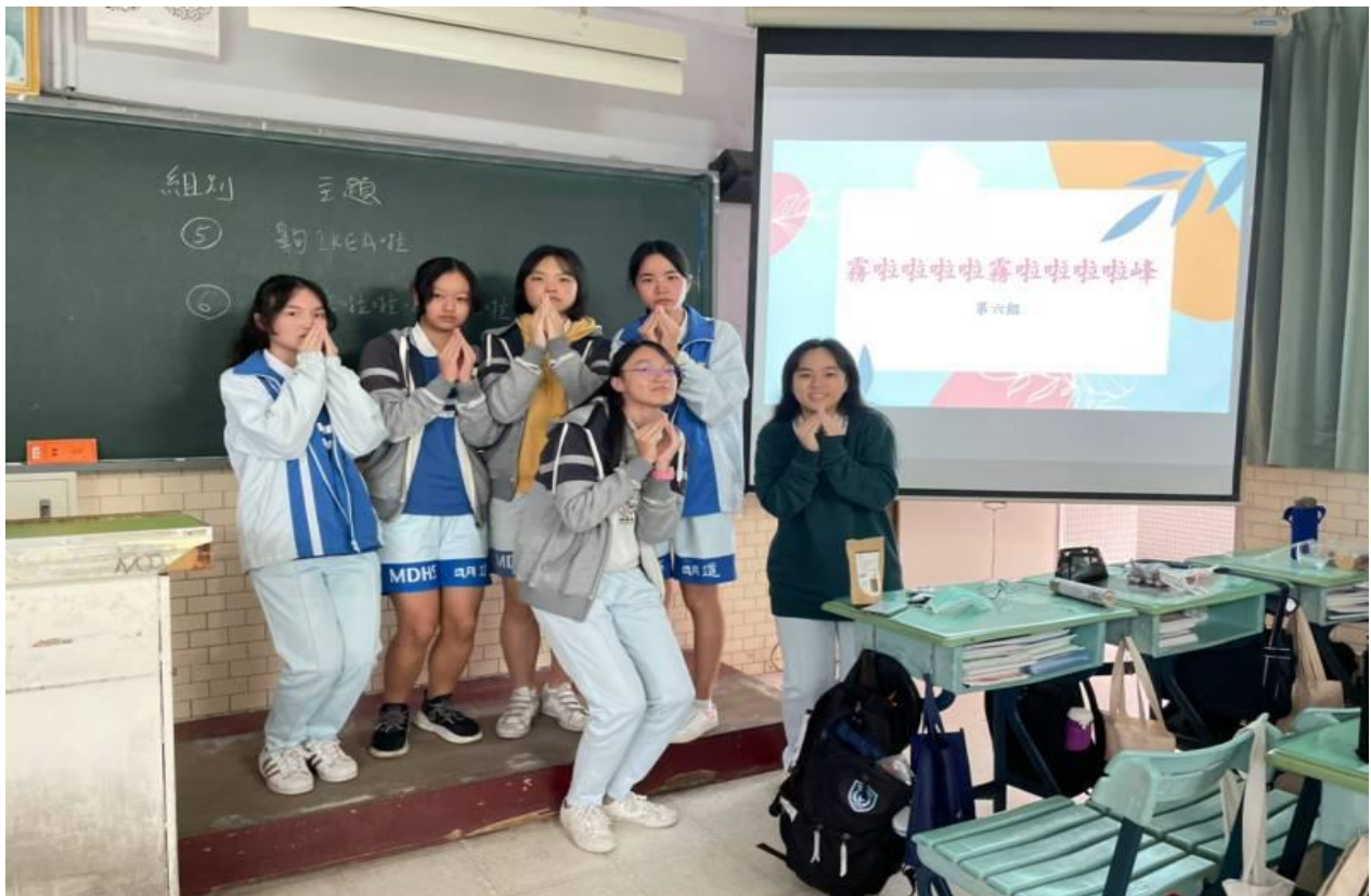
▲照片 6：地方影展大成功——組員們的大合照♥

♥成果報告側錄影片 (2020. 12. 24)，與老師和全班同樂，回味無窮♥：