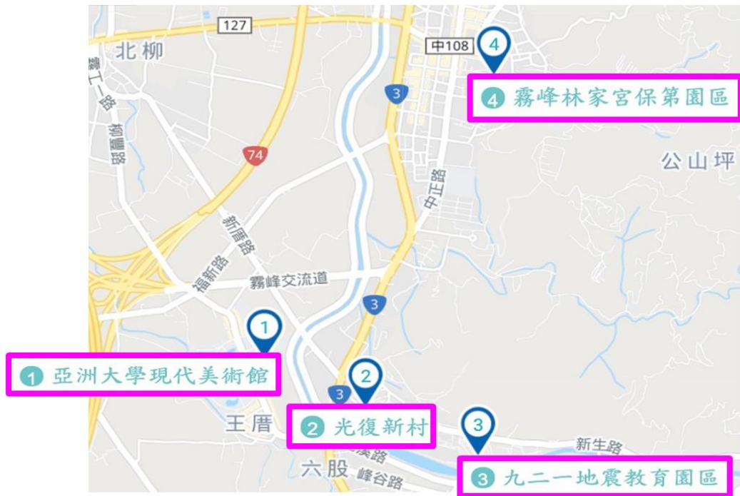
▲小組地理實察路線圖