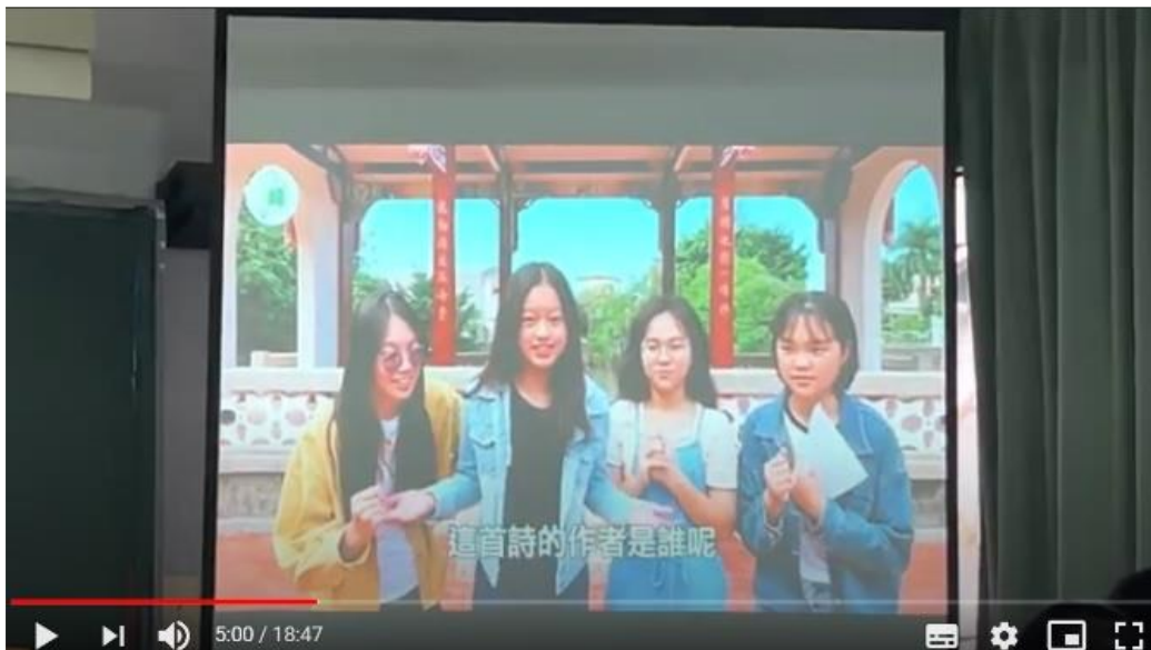
▲照片2：《霧啦啦啦啦霧啦啦啦啦峰》微電影播放ing