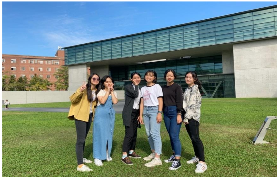
▲小組地理實察照片之一：亞洲大學現代美術館